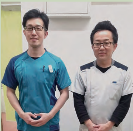
デュエット内科クリニック 放射線科、庶務・総務の職員